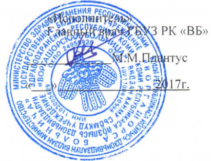
График работы медицинского кабинета ГОУ РК «Санаторная школа- интернат №1» г.Воркуты